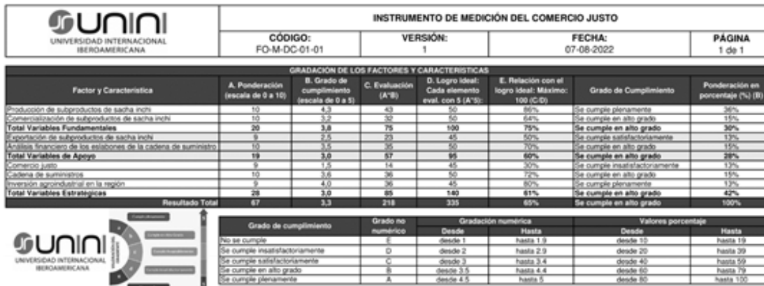
Figura 2. Metodología de seguimiento, valoración y mejora continua.