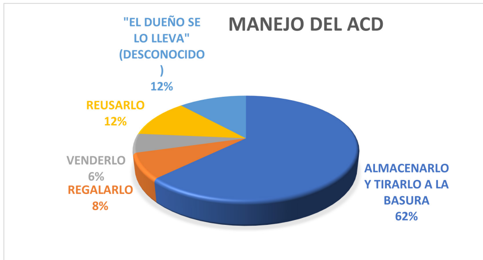
Figura 2. Disposición final del Aceite de Cocina de Desecho de la muestra.