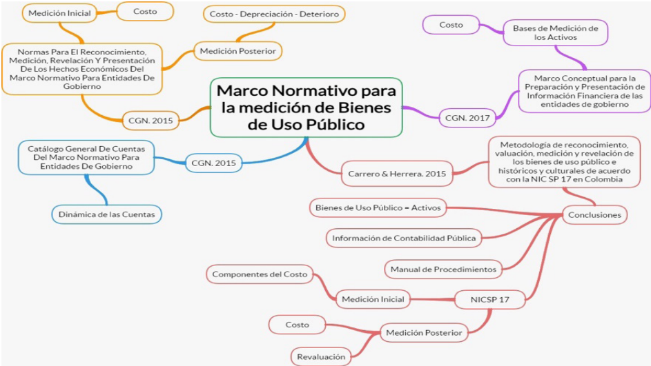
Figura N°1. Resultados rejilla bibliográfica.

en términos concretos, la medición inicial se realizará al costo y la medición posterior se hará al costo menos el deterioro menos la depreciación.