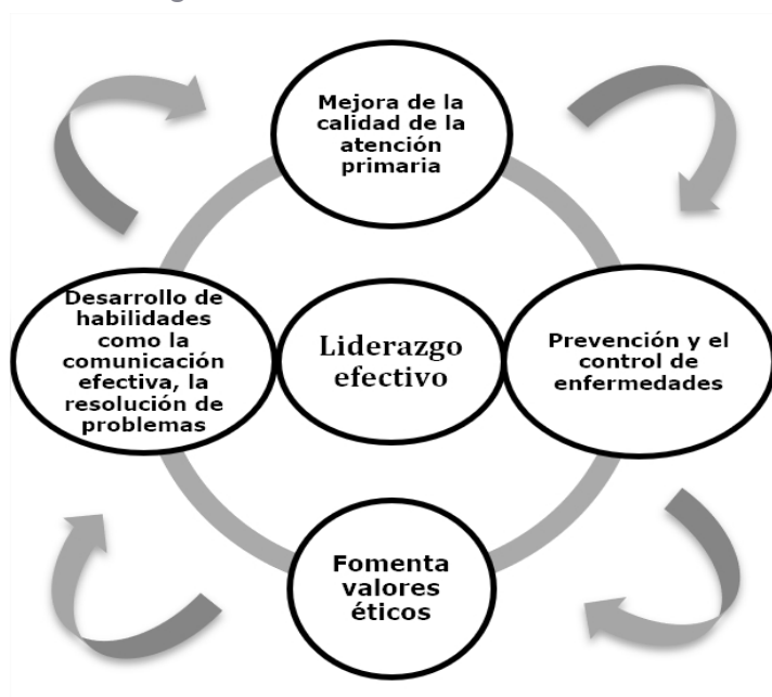
Figura 1. Papel del liderazgo efectivo

de decisiones acertadas en el liderazgo de la administración sanitaria (Hernández, 2020; Díaz et al. , 2021; Rojas et al. , 2022; Arévalo et al. , 2023; Eslava et al. , 2023). Por ende, es imperante que el liderazgo efectivo en la APS requiera ciertas habilidades de liderazgo que permitan a los ASS, enfrentar los desafíos y demandas de su entorno.