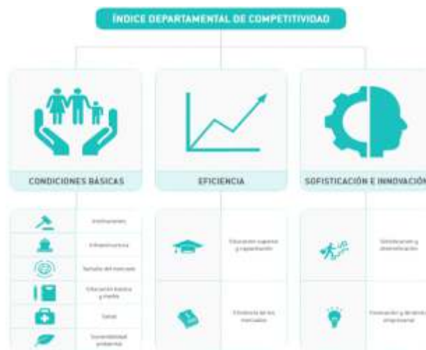
Figura 1. Descripción del Índice Departamental de Competitividad, según pilares.

La importancia de la Agenda Interna para la productividad y la competitividad de Boyacá se destacan los objetivos económicos que garantizan un mayor nivel de bienestar, una sociedad más igualitaria y solidaria, y una sociedad con ciudadanos libres y responsables; esto junto a un estado eficiente al servicio de los ciudadanos.