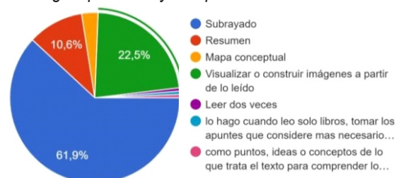
Figura 1. Estrategias para leer y comprender un texto.

Por otra parte, en cuanto a la inclinación de los estudiantes para que a nivel institucional se implementen estrategias, a fin de mejorar los niveles de comprensión lectora se presentan los siguientes resultados (Tabla 4).