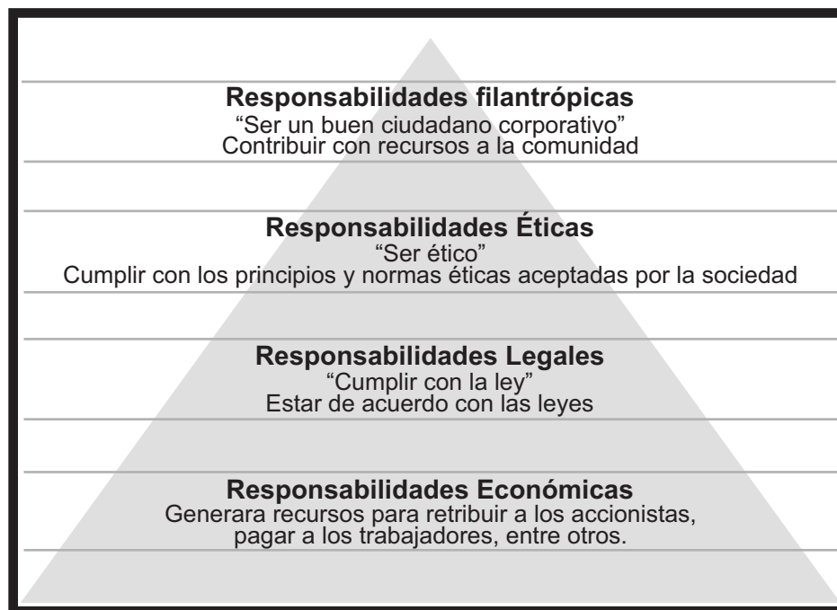
Figura 1. Pirámide de Carroll.

Por lo tanto, la idea central es vincular el concepto de responsabilidad social como un elemento fundamental estratégico en la organización, para lo cual la adopción de la norma ISO 26000 es sin lugar a dudas una de las formas más apropiadas de hacerlo en la medida que es una guía práctica que opera como herramienta de gestión que conecta las políticas de la compañía con las estrategias productivas y