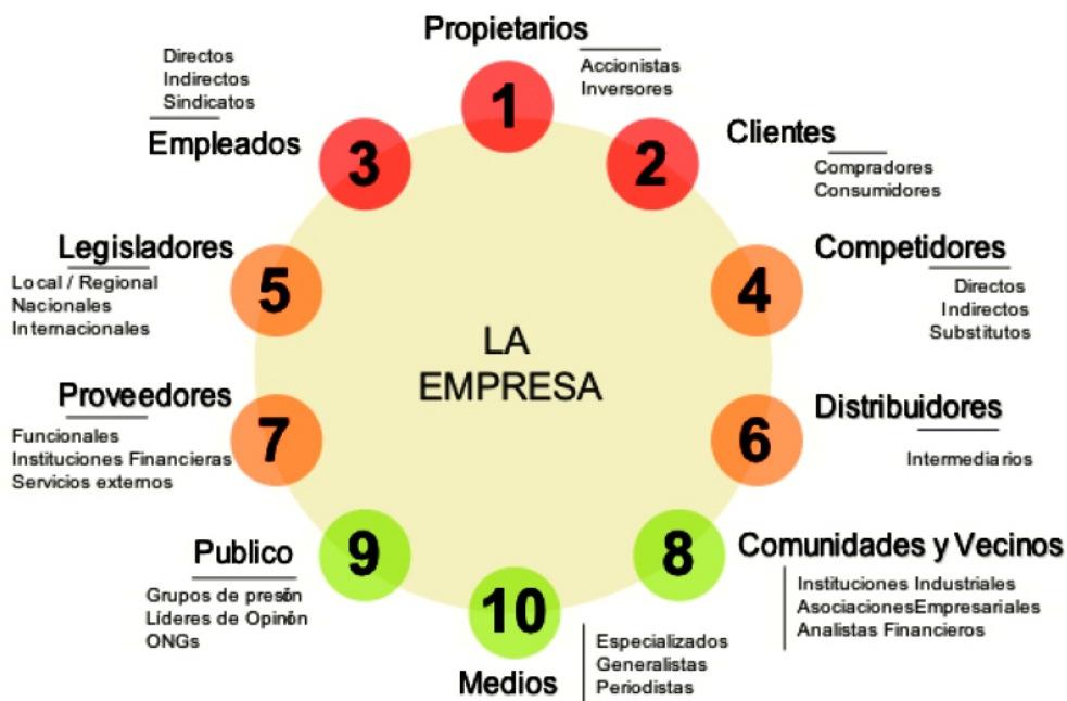
Figura 2. Grupos de Interés o Stakeholders.