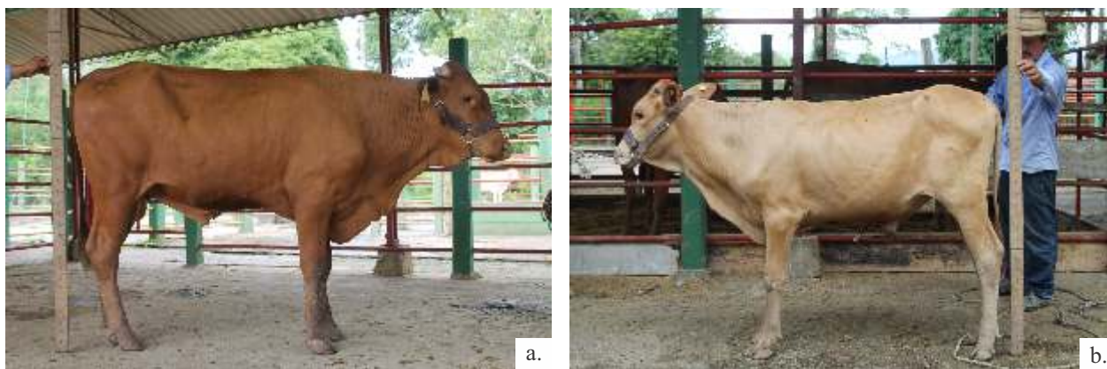
Figura 2. Patrón de tonalidades a. Rojo b. Bayo

Niyas et al , 2015 asegura que animales que presentan colores más claros en su capa con pelaje pino, absorben menos calor que aquellos de colores oscuros y gruesos, lo que se presume como una adaptación evolutiva aplicable al GCC.