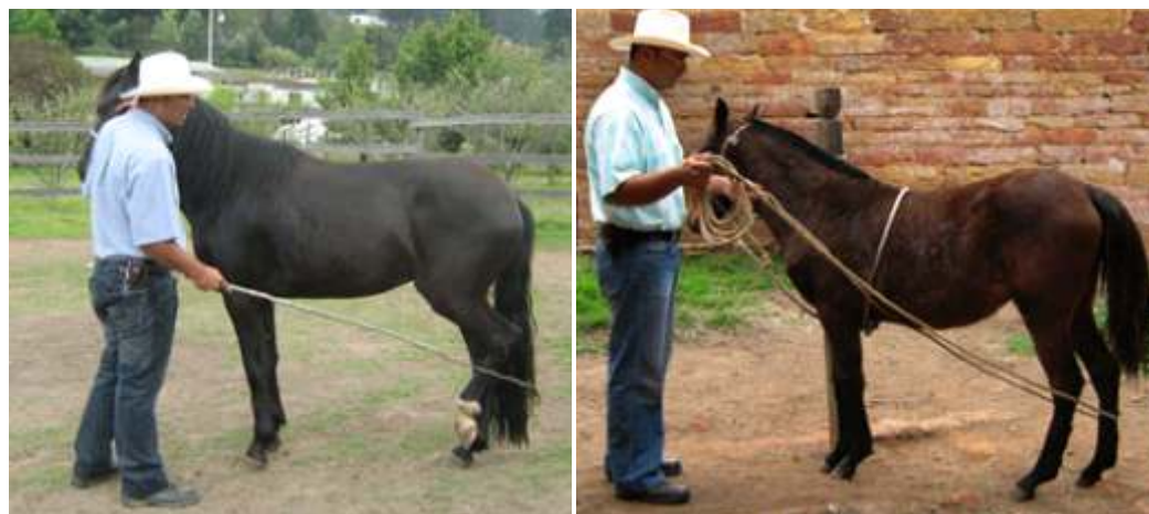
Figura 3. (Izq) y 4 (Der): método de descosquillado extremidades posteriores. Figura 3 Potro dentro del picadero y uso de vara; Figura 4 Potro sujeto al botalón uso de cuerda o lazo.

El potro no puede mantener la tensión en el dorso y lo relaja, llevando el peso del chalan sobre los huesos, sin soporte y amortiguación muscular, resultando en el hundimiento del lomo y pérdida de elasticidad en posteriores, fallando la locomoción, caracterizada por desplazamiento en miembros en arrastre, perdiendo impulsión y elevación (Hoyos, 2009a). Al montarlo, éste se equilibra con el peso de cabeza y cuello actuando como contrapeso (Figura 3 y 4); al comienzo como los músculos de la parte superior del cuello no están desarrollados es de resaltar que a mayor peso del jinete, más abajo debe llevar la cabeza el potro, con esta medida se busca el efecto de contrapeso de la cabeza y el