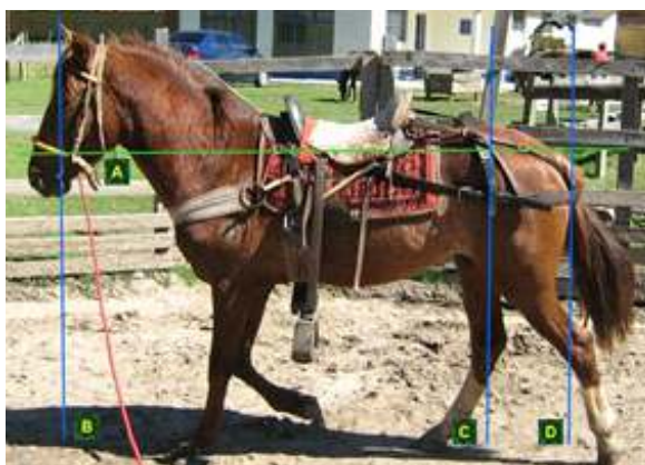
Figura 5. ANTES