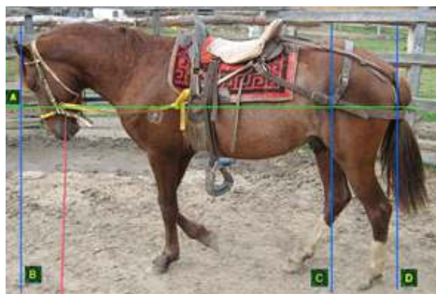
Figura 6. DESPUÉS

Líneas imaginarias efecto trabajo lomo del potro (Trabajo rienda corta)