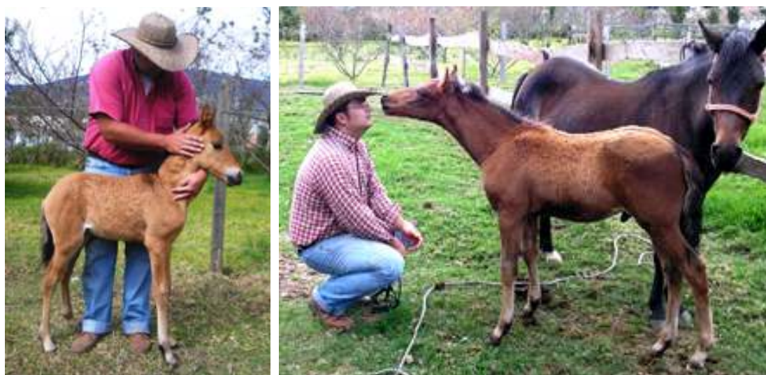
Figura 1 y 2. Potros Imprintados.

Este proceso se aplica hasta el décimo día (Figura 1 y 2), utilizando la manipulación y el contacto del potro con todos los estímulos existentes en su entorno; va desde la sensibilización al contacto del humano por todo el cuerpo y la relación con herramientas que serán usadas en el futuro proceso de doma. Al igual, que las primera cabestreada, cepillado y sujeción a un botalón (Hoyos, 2007c; Oliveira, et al , 2016).