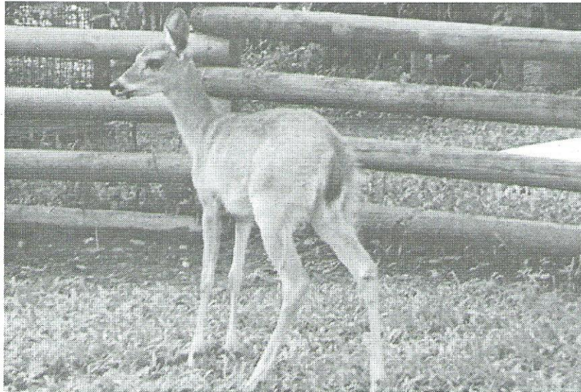
Figura 2. Venado cola blanca en pastoreo

Estadísticamente no hay diferencia significativa ( P < 0,05 ), pero si una diferencia aritmética donde los machos superen a las hembras en un 10% en el peso al nacer, coincidiendo con el estándar de la especie, sugiriendo que esta variable es muy poco afectada por condiciones ambientales.