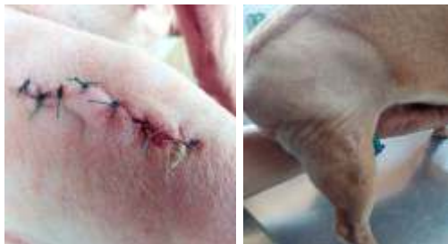
Figura 3. Seguimiento fotográfico del proceso cicatrizal de la paciente

Una vez realizada la osteosíntesis de fémur se continuo el seguimiento post-operatorio, para observar el proceso de cicatrización e inflamación de la herida y seguimiento radiográfico cada mes donde se evaluó el éxito de la intervención mostrando que la alineación, aposición y el aparato, cumplían con lo establecido ortopédicamente (Figura 3).