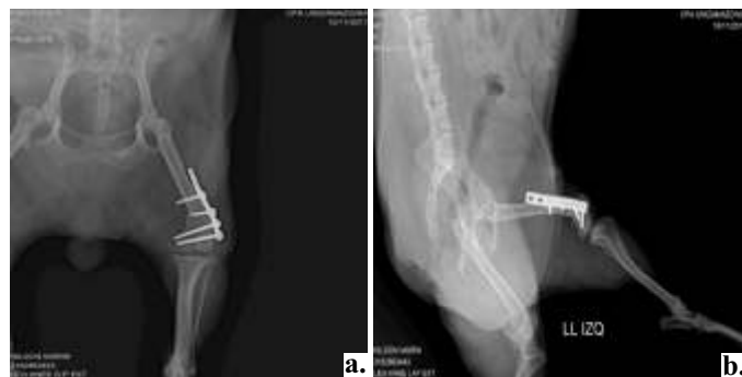
Figura 4. a. RX Vista cráneo-caudal del miembro pélvico derecho con presencia de placa de comprensión ósea. b. RX Vista medio-lateral del miembro pélvico derecho. Con presencia de placa ósea

A la semana trece de haber realizado el procedimiento quirúrgico y el correcto manejo post-quirúrgico se le realizó radiografías de control donde se evidenció la formación de callo óseo como corrector de la fractura y la ubicación de la placa ósea corrigiendo la fractura diafisaria del fémur (Figura 4).